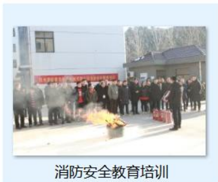
图 6.3-01 消防演练现场

公司每年举行消防演练和各种灾害应急演练。公司制订了《配电房火灾、爆炸应急预案》等应急预案、《触电事件应急预案》、《重大设备故障应急预案》等应急处置方案等，对火灾、机械、触电等均有相应的应急措施，并成立了应急指挥中心和应急救援专业组。