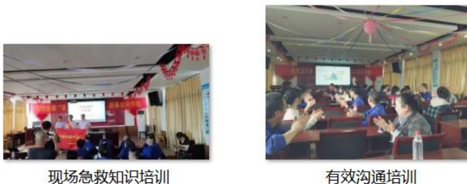
图 3.2-1 各类培训活动

公司将员工学习和发展视为“投资”，把创建学习型组织，营造全员学习的氛围作为公司长期发展战略的重要组成部分。随着公司规模扩大和全球化发展战略的实施，根据企业相关规定及各部门要求确定培训人员的需求情况。各部门负责人确定人员培训需求后经公司领导审批，相关部门每季度根据人员数量酌情进行培训计划的制定与实施。公司并成立了“康华商学院”，见图 3.2-1 所示。